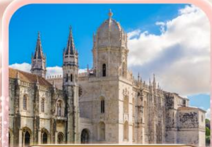
มหาวิหารเจอโรนิโม