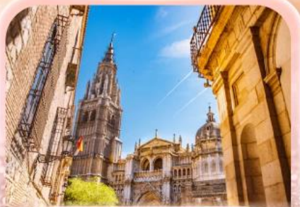
มหาวิหารแห่งโทเลโด