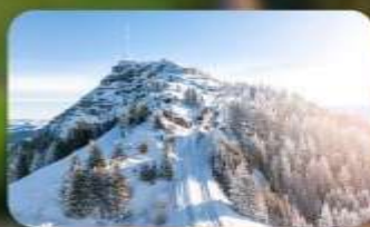
พิชิต 3 ยอดเขาคิง Rigi / Schilthorn / Gornergrat