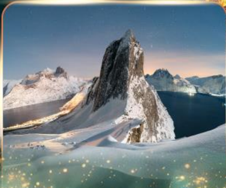
เกาะเซนญา