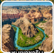
หุบเขาซาริน