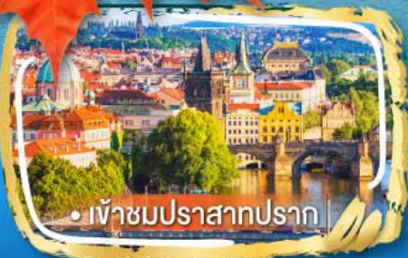
• เข้าชมปราสาทปราก