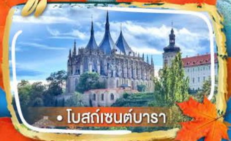
• โบสถ์เซนต์บารา

06-13, 09-16 ต.ค. 69 29 พ.ย. - 06 ธ.ค. 69 05-12 ธ.ค. 69 28 ธ.ค. - 04 ม.ค. 70