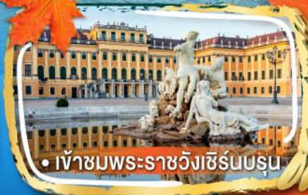
• เข้าชมพระราชวังเซิร์นบรุน