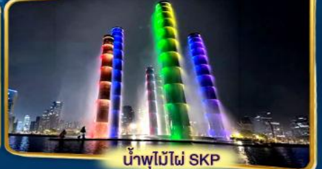
น้ำพุไม้ไฟ SKP