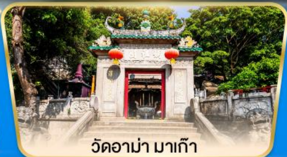
วัดอามา มาเก๊า