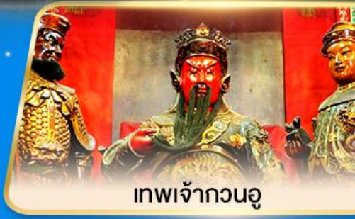
เทพเจ้ากวนอู