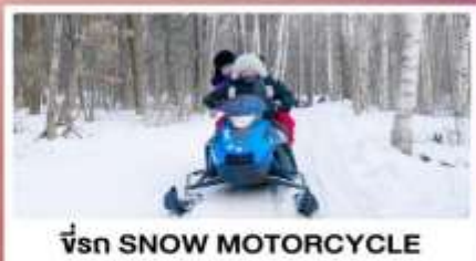
ขี่รถ SNOW MOTORCYCLE