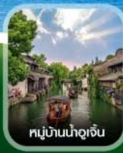
หมู่บ้านน้ำอู๋เจิน