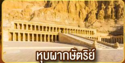
หุบผากษัตริย์