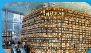
ห้องสมุดสตาร์ฟิลา