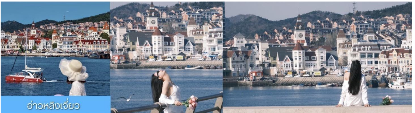
อ่าวหลิงเจี้ยว

จากนั้นนำท่านเที่ยวชม ท่าเรือประมงหู่กาน 大连渔人码头 เป็นจุดเช็คอินที่โดดเด่นด้วยสถาปัตยกรรมสไตล์ยุโรปสีสันสดใส ผสมผสานกลิ่นอายเมืองท่าดั้งเดิมเข้ากับบรรยากาศสุดโรแมนติกที่เต็มไปด้วยเรือประมง คาเฟ่ ร้านอาหาร และจุดชมวิวยุริมาทะเล