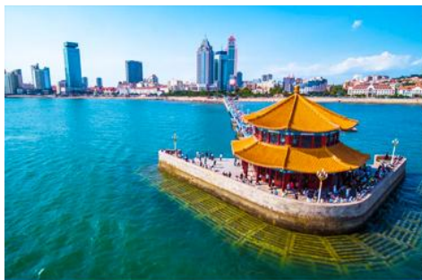
สะพานจ้านเฉียว