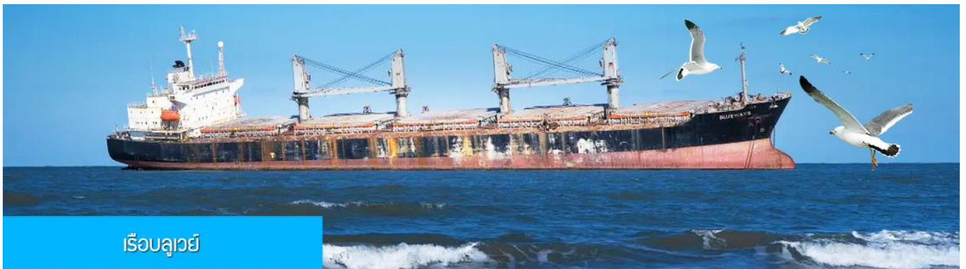
เรือลู่หยี่

นำท่านชมและถ่ายภาพคู่กับ กรอบรูปยักษ์วิวทะเล 威海公园大相框 แลนด์มาร์คที่เป็นอีกหนึ่งไฮไลท์ที่ฮิต ของเมืองเวย์ไห่