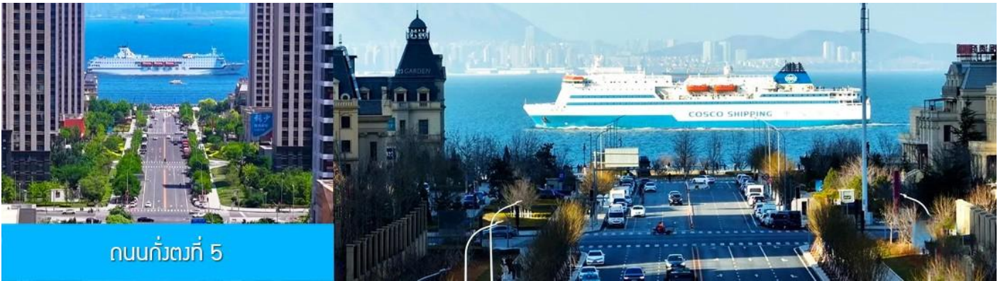
ถนนกั๋วตงที่ 5

หลังอาหารนำท่านเที่ยวชม ถนนกั๋วตงที่ 5 港东五街 จุดเช็คอินใหม่ที่ได้ได้รับความนิยมอย่างสูงจากนักท่องเที่ยวและชาวเมืองต้าเหลียน จุดนี้เป็นช่วงที่ถนนสายกั๋วตงที่ห้า มุ่งตรงสู่ทะเล(มองจากจุดชมวิวที่อยู่ด้านบน) เสมือนว่าปลายทางของถนนไปสิ้นสุดในทะเล อีกด้านจะมองเห็นท่าเรือและอาคารสถาปัตยกรรมตะวันตกเป็นกรอบของมุมมองที่งดงาม เมื่อมีเรือแล่นมาผ่านทะเลตรงบริเวณนี้ จะเป็นภาพที่สวยงามและโรแมนติก