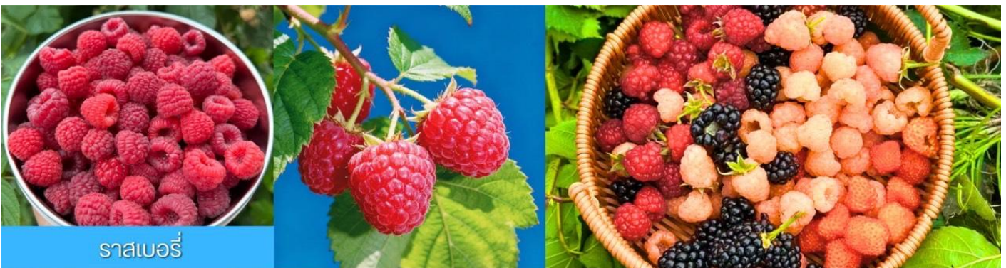
ราสเบอร์รี่