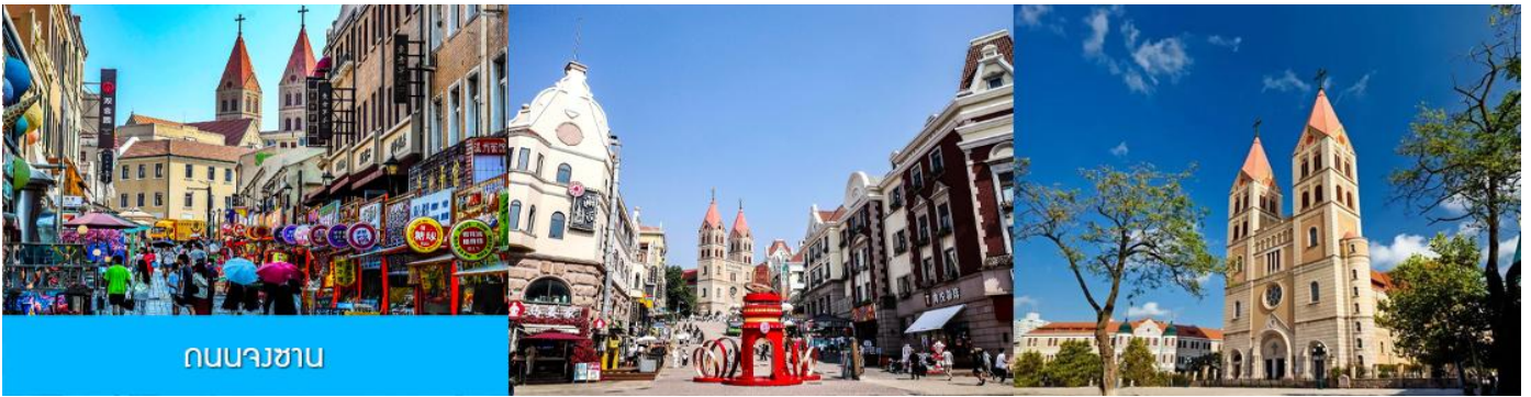
ถนนวงเวียน

จากนั้นเดินทางต่อสู่ย่าน เมืองเก่าเยอรมัน ตรอกกว้างชิงหลี่ 广兴里 ตรอกชอกชอยที่เรียงรายไปด้วยอาคารสถาปัตยกรรมแบบผสมผสานจีนและอาคารสไตล์ยุโรป