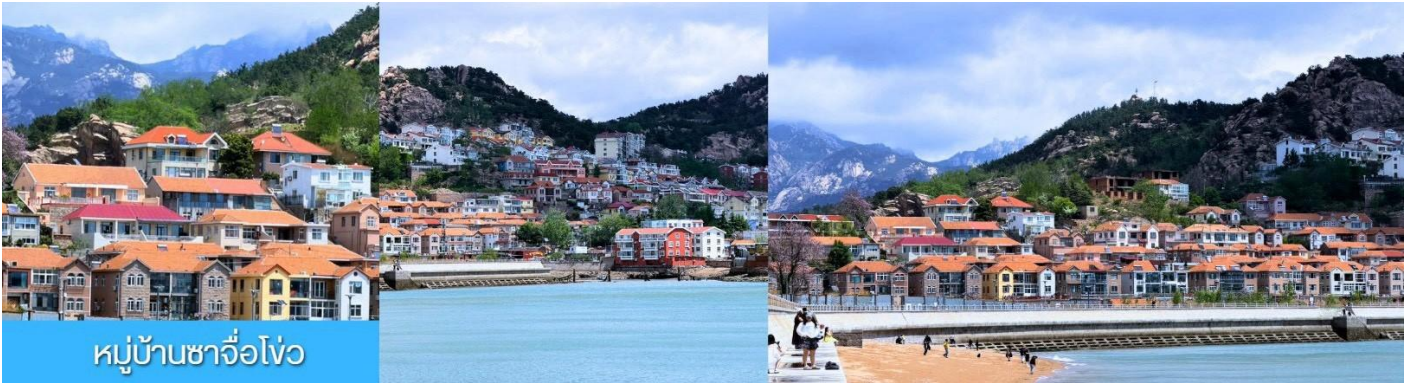
หมู่บ้านชาวโอ้ว