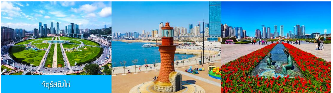
จัตุรัส星海

นำท่านเที่ยวชม ถนนญี่ปุ่น 日本风情街 เป็นอีกหนึ่งแหล่งช้อปปิ้งที่นักท่องเที่ยวไม่ควรพลาด ได้รับฉายาว่าเป็น เกียวโตน้อยแห่งราชวงศ์ถัง 盛唐小京都 ออกแบบโดยสถาปนิกชาวญี่ปุ่น และใช้วัสดุที่นำเข้ามาจากญี่ปุ่นในการก่อสร้าง ที่นี่ถูกเนรมิตให้กลายเป็น เมืองเกียวโตขนาดย่อม และเป็นจุดช้อปปิ้ง ถ่ายภาพ สำหรับนักท่องเที่ยวสมัยใหม่..