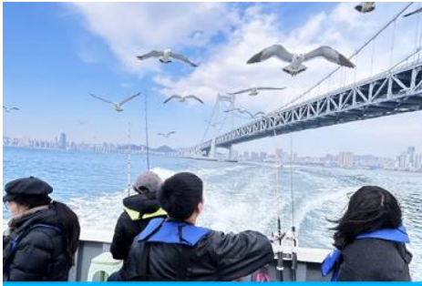
นั่งเรือใบออกทะเลลิ้งนกงางนวล