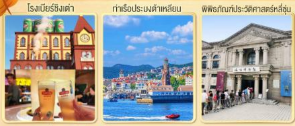
โรงแรมชิงเต่า

Premium Service บิน Full Service (CZ) โหลดกระเป๋าจัดเต็ม อาหารดี ที่พักรับดับ 4 ดาวมาตรฐาน