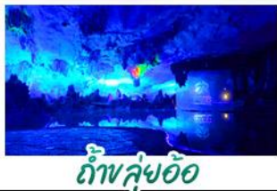
ถ้ำคู่อ้อ

เขารู้อี+สะพานแดง - ล่องเรือแม่น้ำห่อเจียง นาขั้นบันไดสีทองอร่าม - กำแพงสุ่ยอ้อ - ทางวงช้าง เจดีย์เงินเจดีย์ทอง - รถไฟความเร็วสูง เมฆพิเศษ บุปผาฟ้าย่างบาร์บีคิว ปลาอบเบียร์ เผือกคริสตัล สุกี่เห็น