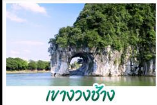
ทางวงช้าง