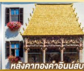
หลังคาทองคำอินน์ส์บรุค