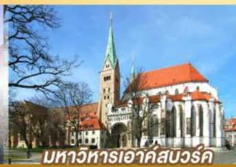
มหาวิหารเอาก์สเวิร์ค