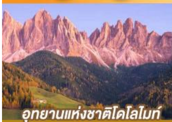
อุทยานแห่งชาติโดโลไมท์