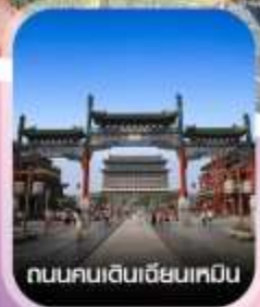
ถนนคนเดินเฉียนเหมิน

✈️ คอนเฟิร์มออกเดินทาง ทุกพีเรียด 2 ท่านขึ้นไป