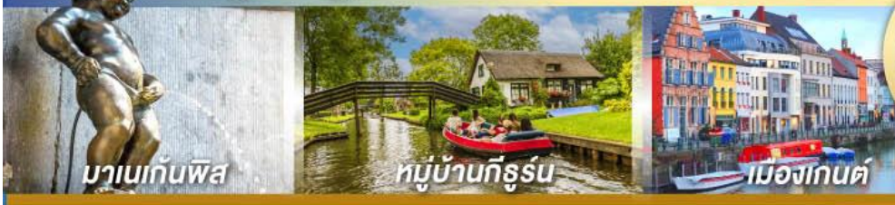
มานเนกันพิส หมู่บ้านทึร์รูน เมืองกันต์