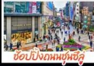
ซ้อมบึงกมมชุนซี้