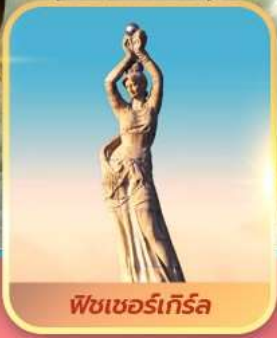
พีชเซอร์เกิร์ล