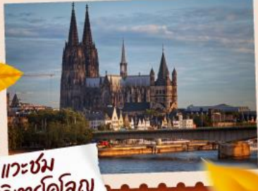
แวะชม มหาวิหารโคโลญ