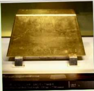
พิพิธภัณฑ์ทองคำ