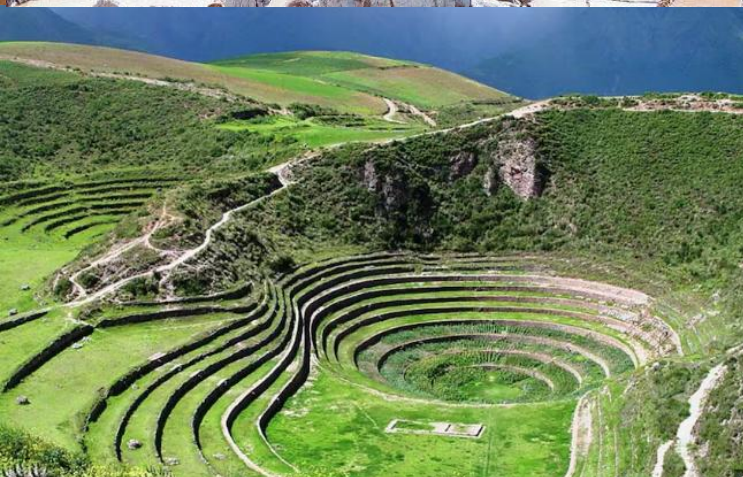
บ่าย นำท่านเดินทางสู่ มาราซ (Maras) แหล่งผลิตเกลือที่คุณภาพดีที่สุดในโลก ที่มีมาตั้งแต่สมัยอินคา แนวนาชั้นบันไดที่เรียงอยู่ตามลำดับความสูงของภูเขา จากนั้นเดินทางสู่ โมเรย์ (Moray) นาชั้นบนโดวงกลมขนาดใหญ่หลายๆรูปร่างแปลกตาที่ชาวอินคาทำไว้เพื่อทดลองปลูกพืชพันธุ์ต่างๆ จากจุดนี้สามารถมองเห็น หมู่บ้านอูรัมบัмба (Urubamba) ได้อีกด้วย ได้เวลาเดินทางกลับสู่เมือง เมืองคัสโก (Cusco) เมืองหลวงของอาณาจักรอินคา ที่แพร่ขยายอำนาจจนกินพื้นที่ 1 ใน 3 ของอเมริกาใต้ ตั้งอยู่เหนือระดับน้ำทะเลถึง 3,400 เมตร และเป็นแหล่งอารยธรรมยุคก่อนประวัติศาสตร์ที่ลึกลับน่าทึ่ง เป็นชุมชนเก่าแก่ของจักรวรรดิอินคาอันรุ่งเรือง ซึ่งยังคงทิ้งร่องรอยความเจริญไว้ให้เห็นเป็นซากปรักหักพังโบราณและโบราณวัตถุต่างๆ