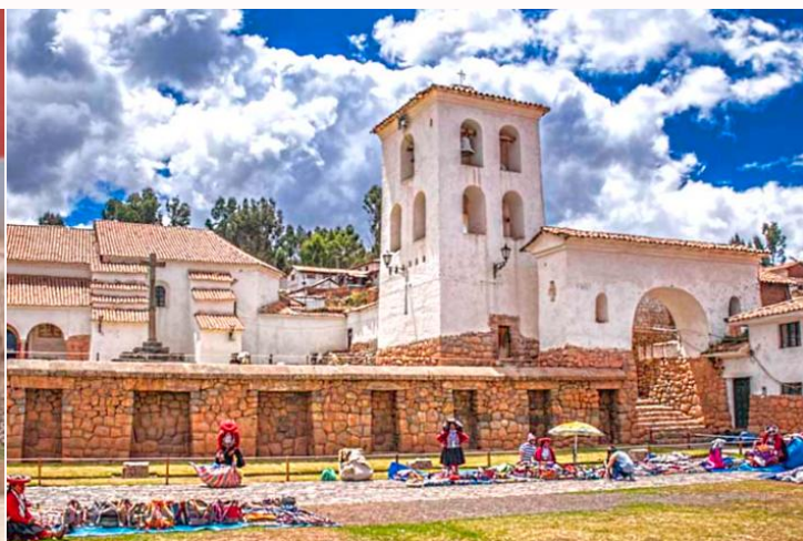
เที่ยง บริการอาหารกลางวัน ณ ภัตตาคาร Hanka Restaurant