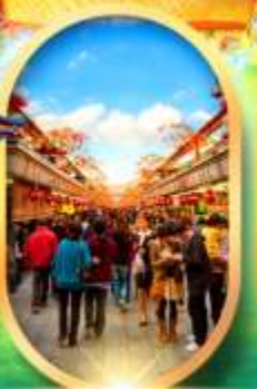
ถนนนากามิเสะ