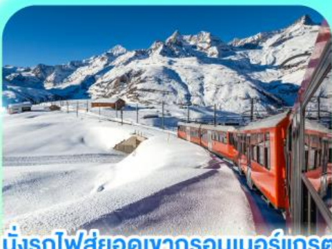
นั่งรถไฟสู่ยอดเขารอนเนอร์แอนด์