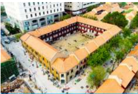
เมืองเก่าเยอรมัน ตรอกกว้างซิงลี่