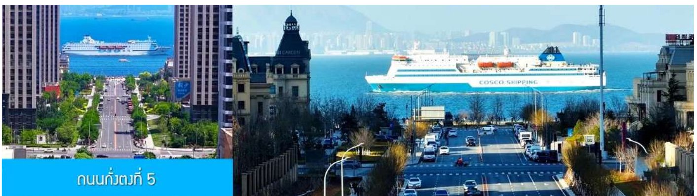
ถนนกั๋วตงที่ 5

นำท่านเที่ยวชม จัตุรัส星海 星海广场 เป็นจัตุรัสขนาดใหญ่เป็นแลนด์มาร์คสำคัญของเมืองต้าเหลียน สร้างขึ้นเพื่อเฉลิมฉลองในโอกาสที่รัฐบาลอังกฤษคืนเกาะฮ่องกงในให้จีนในปี ค.ศ. 1997 ตั้งอยู่ชายฝั่งทะเลในเมืองต้าเหลียน เป็นจัตุรัสใจกลางเมืองที่ใหญ่ที่สุดในโลกและ เป็นแลนด์มาร์คของเมืองต้าเหลียน รายล้อมด้วยตึกระฟ้าที่ทันสมัย ภายในมีบ่อน้ำพุดนตรี ลานหญ้าขนาดใหญ่ และลานกว้างสำหรับจัดกิจกรรมกลางแจ้ง อาทิ เทศกาลเบียร์นานาชาติ การแข่งขันวิ่งมาราธอน งานแฟชั่นนานาชาติเมืองต้าเหลียน ฯลฯ