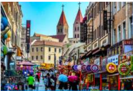
ถนนวซซาน