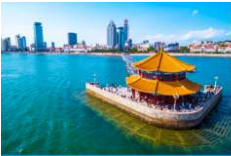
สะพานเจี้ยนเจียว