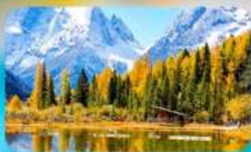
กูเวาสี้ครุณี