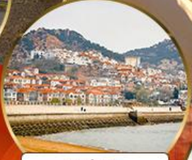
ซาร์จื่อซ่า