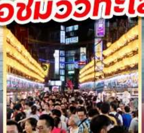
ไถจงไนท์มาร์เก็ต