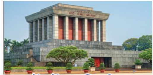
จัตุรัสบาติงห์