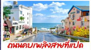
ถนนคาเฟ่คิงสาขที่แปด