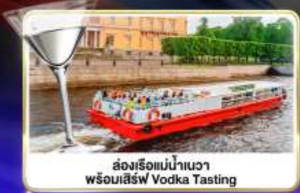
ล่องเรือแม่น้ำนาวา พร้อมเสิร์ฟ Vodka Tasting