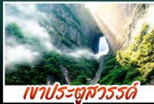
เขาประตูลสวรรค์