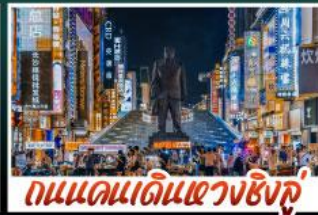
ถนนแดนเดินแดงชิงซู