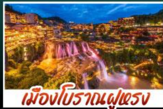
เมืองโบราณผู่ตรง