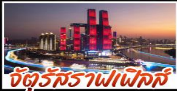
จัตุรัสราฟาเอลส์