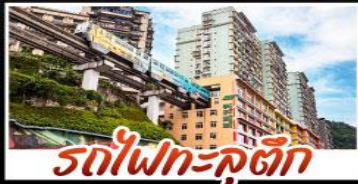
รถไฟฟ้า-คูตึก