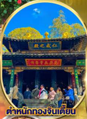
ตำหนักทองจินตายน