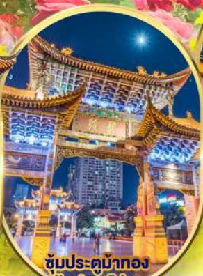
ชมประติมากรรม และ ชมประตูโถงมรกต