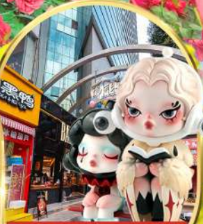
POP MART ถนนคนเดินหนานผิงเจีย