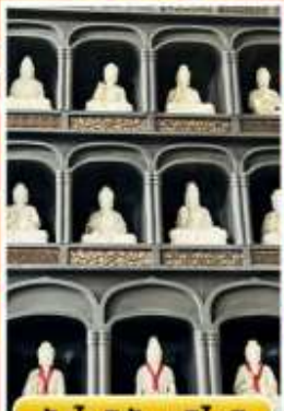
วัดไดชิซังเซอิโดจิ