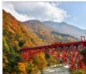
รถไฟชมวิวยุขุมเงาคุโรมะ