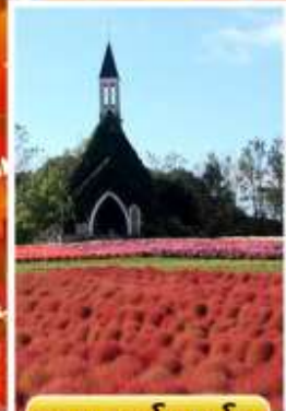
สวนบกกะโนะซาโตะ