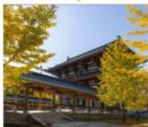
วัดไดชิซังเซอิไดจิ