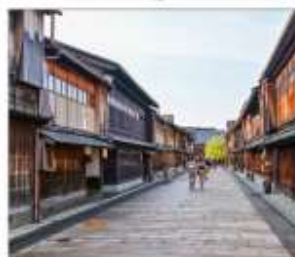
ย่านโรงน้ำชาอิงาชิซายะ