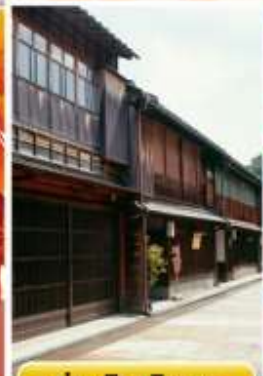
ย่านอิงาชิซายะ