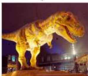
พิพิธภัณฑ์ไดโนเสาร์