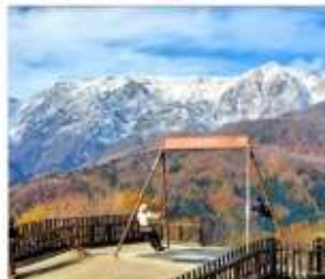
ฮาดุบะอิวาทาเกะ