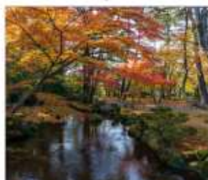
สวนเคนโระคุเอ็น