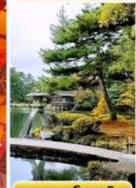
สวนเคนโระคุเอิน

🍽️ ออนเซ็น 3 คั้น 🧳 นน.กระเป๋า 23 กก. ☀️ 7Days 5Night