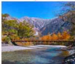
ดามิโดจิ