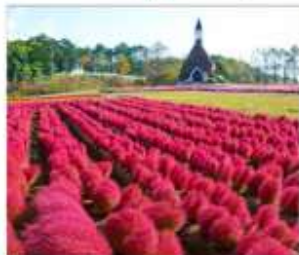
สวนดอกไม้ไม้กกระโนะซาโตะ