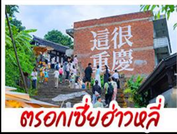
ตรอกเซี่ยฮ่าวหลี่