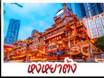
ตงเฉยตัง