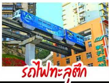
รถไฟทะลุติ๊ก