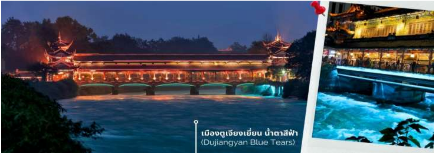
เมืองดูเจียงเยียน น้ำตาสีฟ้า (Dujiangyan Blue Tears)

ราวกับโลกแห่งจินตนาการ ความพิเศษอยู่ที่การจัดไฟอย่างประณีต ซึ่งช่วยเน้นให้สะพานมีชีวิตชีวาท่ามกลางบรรยากาศยามค่ำคืนที่รายรอบไปด้วยภูเขาและต้นไม้เพิ่มความรู้สึกสงบและสดชื่น เมื่อเดินข้ามสะพานนี้แล้วได้สัมผัสกับบรรยากาศรอบๆ มีแสงไฟที่ส่องประกายลงสู่ผืนน้ำจึงเป็นประสบการณ์ที่ทำให้รู้สึกผ่อนคลายและเต็มไปด้วยความประทับใจที่ยากจะลืม