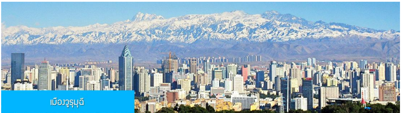
เมืองวุรูมูฉี