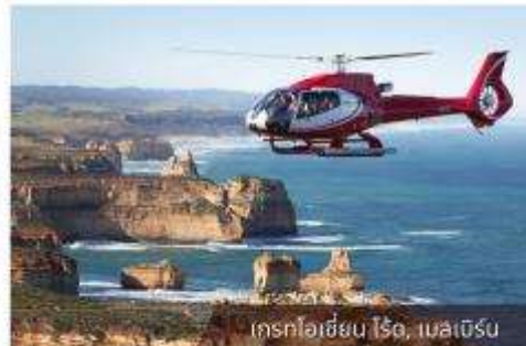
เฮลิคอปเตอร์, เมลเบิร์น