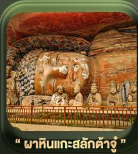
“ พาทินแคะสลักต้าจู้ ”