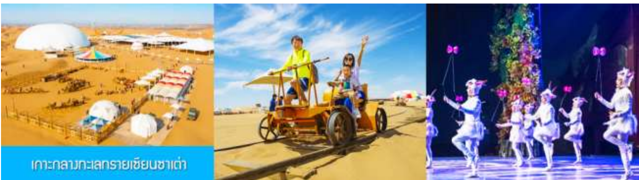
เกาะกลางทะเลทรายเขียนซาเต๋า