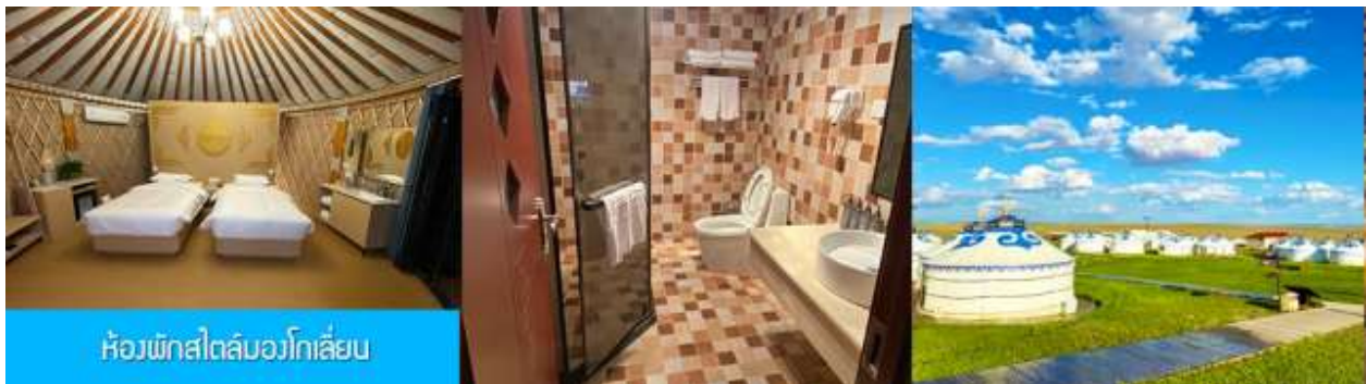
ห้องพักสไตล์บอวก์โกเลียน