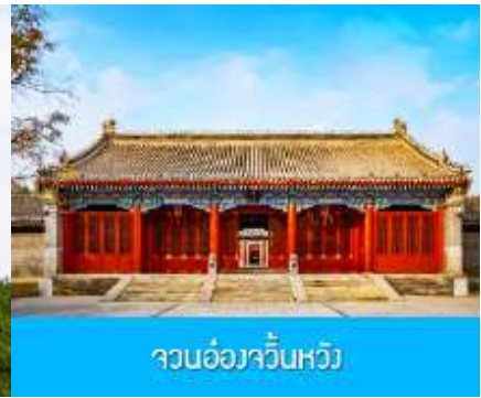
จวนอ๋องจวินหวัง

วันที่หก เมืองเออร์ดอส - อี้เค่อเอ้าเป่า - พิพิธภัณฑ์เครื่องเงิน - จวนอ๋องจวินหวัง - สวนวัฒนธรรมหมงกู่หยวน หลิว - ซุปป์ถนนคนเดิน - บินกลับกรุงเทพฯ