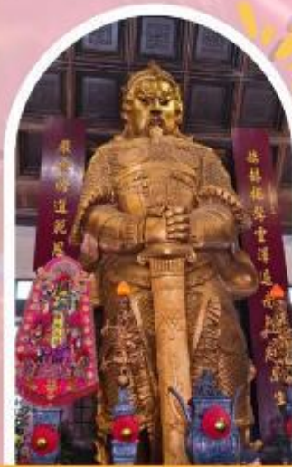
วัดแชกง ขอพรโชคลาก การเงิน และธุรกิจ