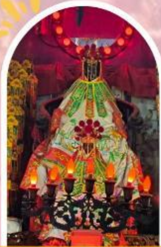
วัดเจ้าแม่กวนอิมฮ่องกง ขอพรเรื่องเงิน ทรัพย์สิน และความมั่งคั่ง