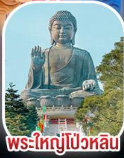
พระใหญ่โป้วหลิน