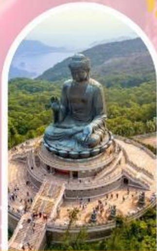
นั่งกระเช้ามองปิง นมัสการพระใหญ่โปวหลิน