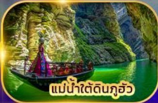
แม่น้ำใต้ดินกุ้ยโจว