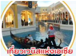
เที่ยวเวนิสแห่งเอเชีย