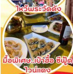
มือพิเศษ...เป่าอ้อ ซิฟู๊ด ไวน์แดง