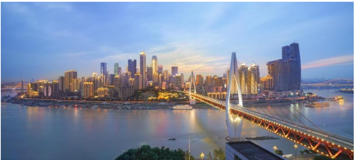
ที่พัก VIENNA HOTEL CHONGQING AIRPORT หรือเทียบเท่าระดับ 4 ดาว (มาตรฐานประเทศจีน)

23.50 น. เดินทางถึง ท่าอากาศยานนานาชาติสนามบินฉงชิ่ง เจียงเป่ย์ เมืองฉงชิ่ง "ฉงชิ่ง" มหานครที่ใหญ่ที่สุดทางภาคตะวันตกเฉียงใต้ของจีน ที่นี่ไม่ใช่แค่เมืองที่มีตึกสูงระฟ้า แต่เป็นเมืองที่เติบโตขึ้นตามแนวขุนเขาและโอบล้อมด้วยสายน้ำอย่างน่าอัศจรรย์ ได้รับสมญานามว่า "เมืองแห่งภูเขา" ฉงชิ่งคือบทพิสูจน์ของความสามารถอันน่าทึ่งของมนุษย์ในการปรับตัวและสร้างสรรค์สิ่งก่อสร้างให้กลมกลืนไปกับธรรมชาติที่ท้าทายจากนั้นนำท่านผ่านขั้นตอนตรวจคนเข้าเมือง รับกระเป๋าสัมภาระ จากนั้นนำท่านออกเดินทางเข้าสู่ที่พัก