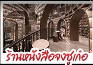
ร้านหมี่งสี่องซูทื่อ

อุทยานภูเขาสิ่ครุณี อุทยานบ่ิงโกว หมี่แพนด้ำนอนเชลพี ร้านหมี่งสี่องซูทื่อ วัตต้าฉือ ถนนโบราณควนจ่าย ซ้อปบ่ิงยำนคิง ถนนไท่กูหลี่ + ถนนซุนซู่ เมบูพิศษ สุกั้หมาล่าเสวณ