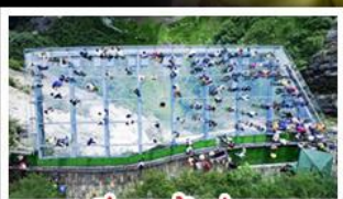
ระเปียงงแก้วอยู่หลง