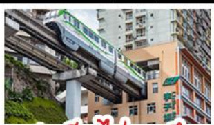
สถานีรถไฟทะเลตึก

ฉงชิ่ง - อุ้งหลง - หงหยาดัง - อุทยานเขานางฟ้าฉงชิ่ง สถานีรถไฟทะเลตึก - หลุมฟ้าสามสะพานสวรรค์