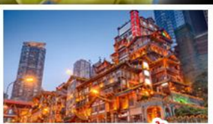
ตลาดแดงเฉาตัง