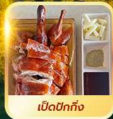
เปิดปอกกิ้ง