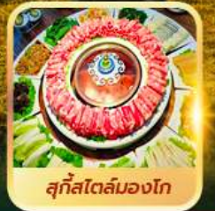
สุกีสโตลมองโก