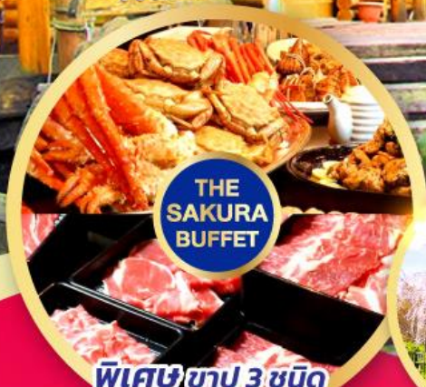
พิเศษข่าปู 3 ชนิด (ปูทะเล+ปูม้า+ปูขนิ)