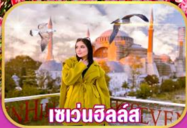
เขวันซิลลัส