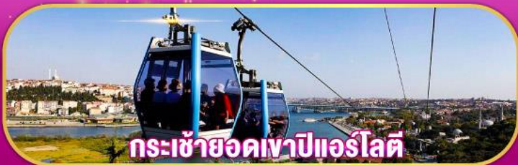
กระเช้ายอดเขาปีแอร์โลตี

ชมดอกไม้บานที่สวนอันบอร์กัน พร้อมเข้าชม “ปราสาทเทพนิยายชาโซวาแห่งเอสเคเซีย” และ ชมวิวบนยอดเขาปีแอร์โลตี